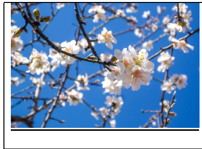
השקדיה פורחת ושמש פז זורחת, צפורים מראש כל גג מבשרות את בוא החג.

Rav Avuna teaches: "I see a rod of an almond tree" (Yirmiyahu 1:11). Just as this almond bud takes 3 weeks from it's initial sprouting until it is a fully formed fruit, so too there are 21 days between the breaching of the walls of Yerushalayim and her destruction